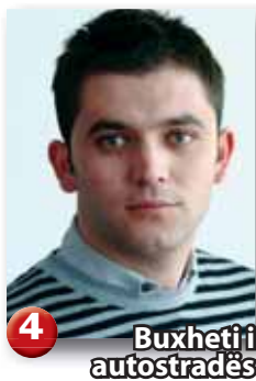
4 Buxheti i autostradës

Portreti i muajit: U dekorua mikja e Kosovës ..... 2