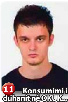
11 Konsumimi i duhanit në QKUK...