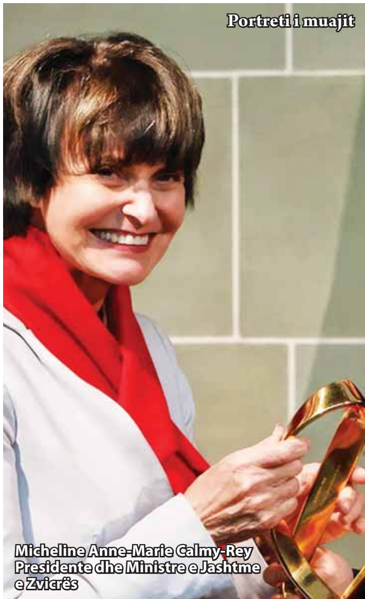
Micheline Anne-Marie Calmy-Rey Presidente dhe Ministre e Jashtme e Zvicrës