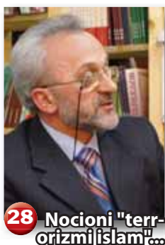
28 Nocioni "terrorizmi islam"...