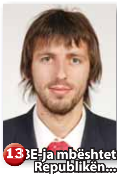
13 BE-ja mbështet Republikën...