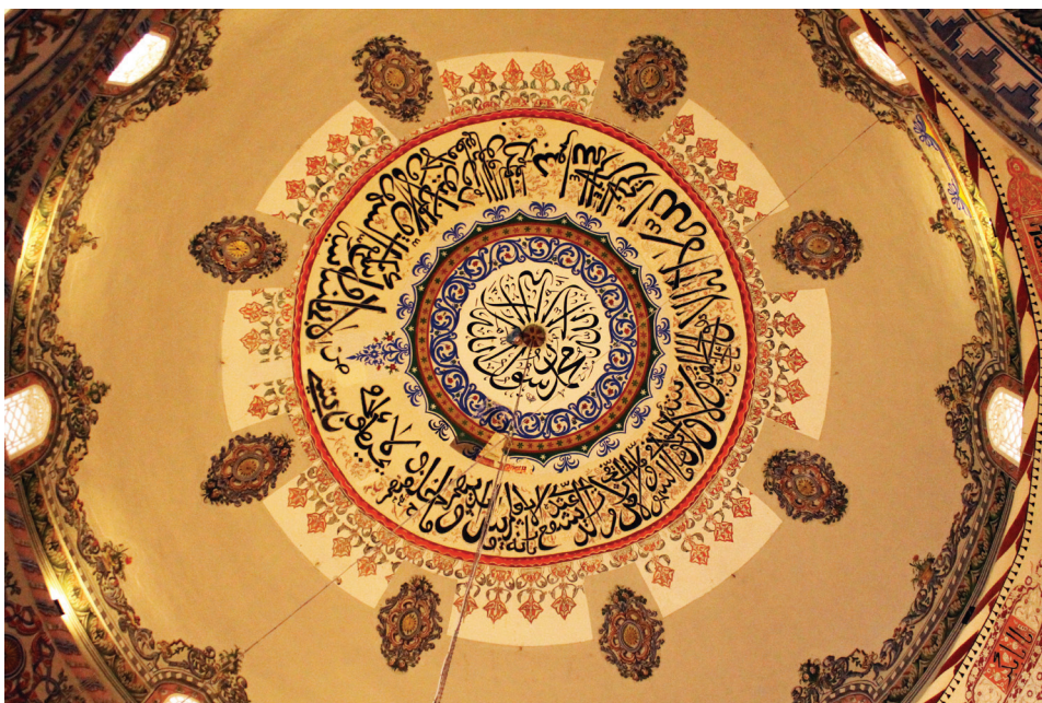
Kupola e xhamisë Sinan Pasha, Prizren