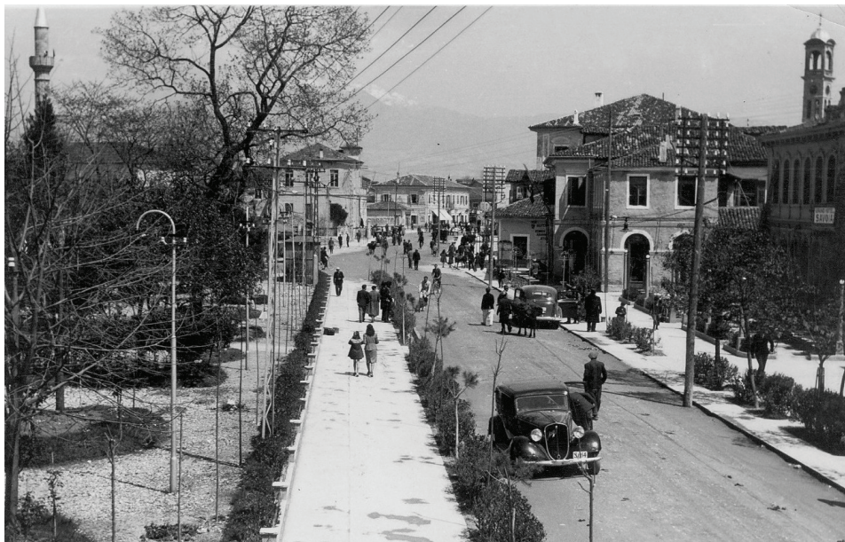
Xhamia e Fushë Çelës dhe Kisha e Fretënve në Shkodër përballë njëra-tjetrës. Këto dy objekte kulturi me 28 nëntor 1913 (me rastin e 1 vjetorit të pavarësisë), u lidhën me kandilë dhe flamuj nga At Gjergj Fishta.

Sot, ne shqiptarët jemi më të vetëdijshëm që të luftojmë më shumë për fuqizimin e faktorëve, që ndihmojnë dhe ushqejnë harmoninë dhe bashkëjetesën paqësore fetare e kultivuar historikisht, duke luftuar dhe shmangur ndikimet negative, që mund tu imponohen shqiptarëve kryesisht nga jashtë Shqipërisë.