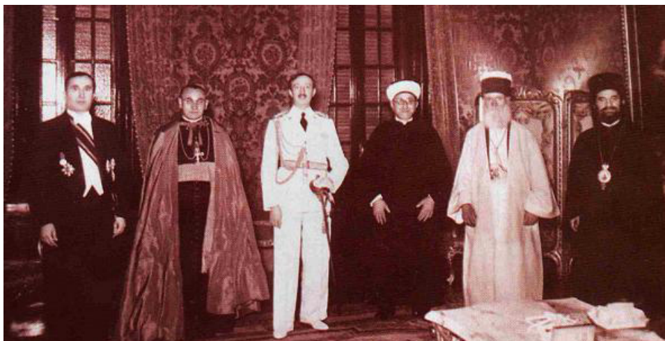
Mbreti Zog me krerët e komuniteteve fetare

Komunitetet fetare, gjithashtu, quheshin të formuara dhe gëzonin të drejtat e akorduara prej ligjit, vetëm kur Statuti i paraqitur prej tyre, aprovohej prej Këshillit të Ministrave dhe dekretohej nga Mbreti.