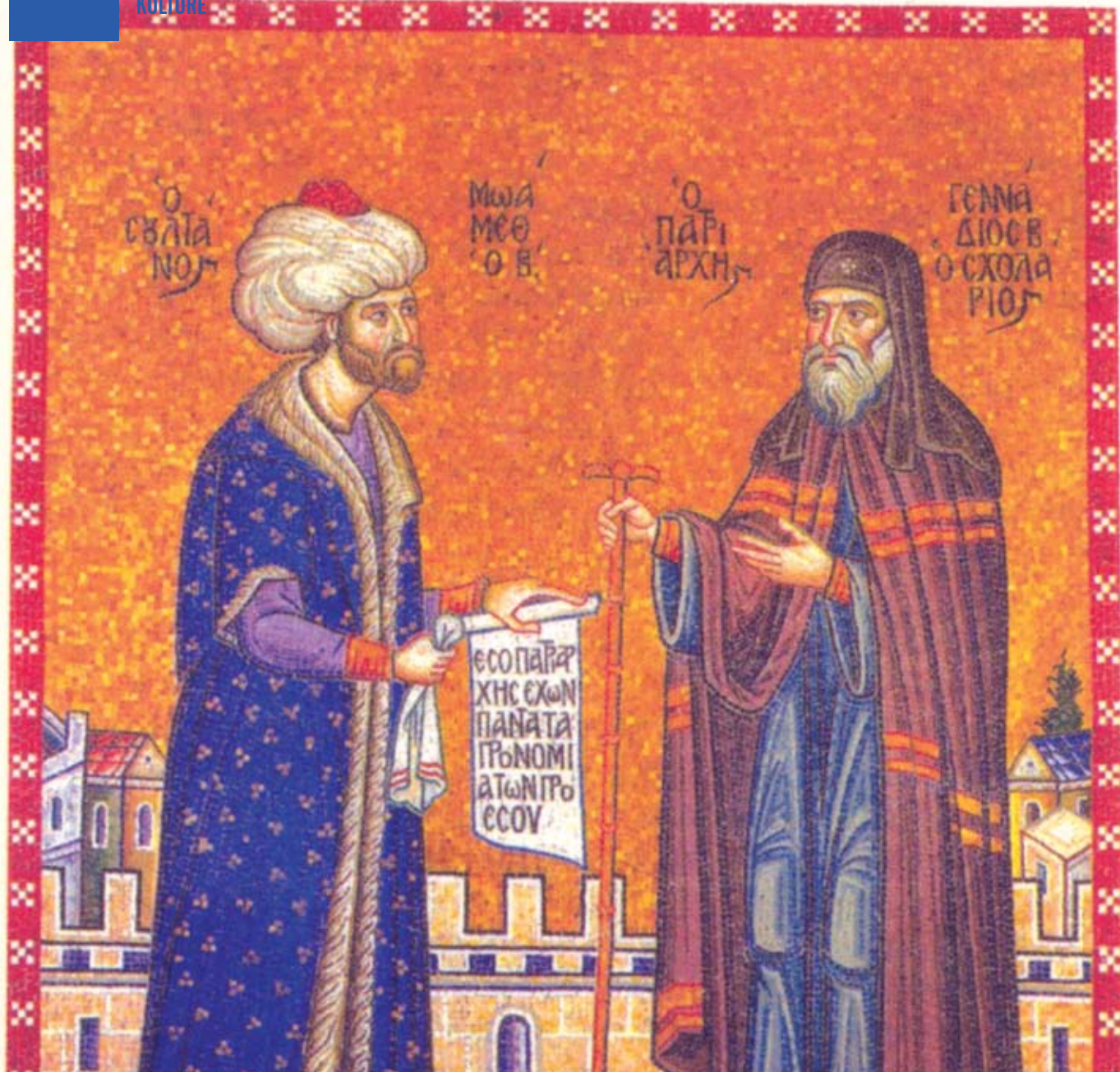
Sulltan Mehmet II Fatihu me Patriarkun Gennadios