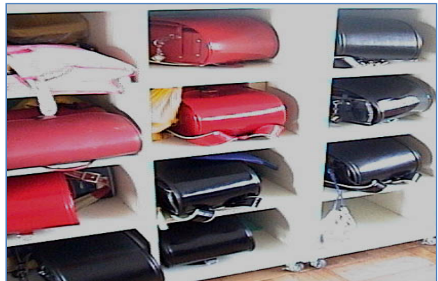
Pamje nga brendësia e klasës, ulëset dhe raftet për vendosjen e çantave.