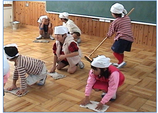
Nxënësit, po kështu, pastrojnë bashkërisht edhe dyshemenë e klasave.