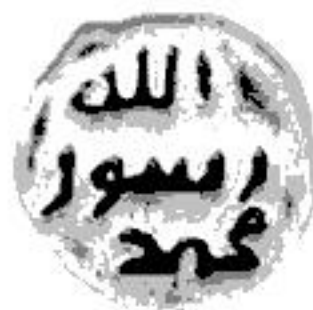
Pejgamberi i Allahut Muhammed

Kushdo që refuzon ta paguajë këtë vlerë, duhet të konsiderohet armik i Allahut, i Pejgamberit të Tij dhe i të gjithë muslimanëve 53 .