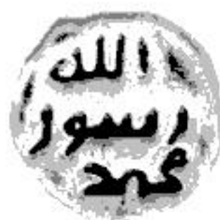
Pejgamberi i Allahut Muhammed

Cilido prej këtij populli që përqafoi Islamin, kryen namazin, paguan zekatin, i bindet Pejgamberit (s.a.v.s.), paguan humsin për Allahun dhe Pejgamberin e Tij (s.a.v.s.) nga fitimet e luftrave dhe deklaroi Islamin e tij, është nën mbrojtjen e Allahut dhe Pejgamberit të Tij (s.a.v.s.). Çdo gjë, që ishte e tyre në kohën e përqaimit të Islamit do të mbetet e tyre. Ata do të konsiderohen si pronarë të vendit brenda kufijve ku shtrihen dhentë kur janë duke kullotur 100 .