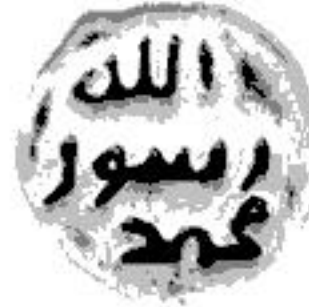
Pejgamberi i Allahut Muhammed

Këtyre njerëzve u jepen tokat e luginës Akik. Derisa ata do të vazhdojnë të kryejnë namazin, të paguajnë zekatin dhe të mbeten të bindur ndaj Allahut dhe Pejgamberit të Tij (s.a.v.s.), ata do të gëzojnë të drejtën të marrin përfitimet prej luginës Akik 89 .