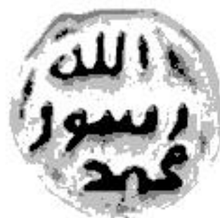
Pejgamberi i Allahut Muhammed

Paqja qoftë mbi atë që pason udhëzimin, beson tek Allahu dhe Pejgamberi i Tij. Unë dëshmoj se askush s'është i denjë për t'u adhuruar, përveç Allahut, i cili është Një i Vetëm dhe s'ka shok, dhe se Muhammedi është rob dhe Pejgamber i Tij. Allahu më ka zgjedhur mua Pejgamber dhe më ka dërguar për mbarë botën, me qëllim që unë të mund të fus bindjen ndaj Allahut, tek çdo njeri. Prano Islamin dhe do të jesh i sigurt. Nëse ju refuzoni, mëkatet e të gjithë Zoroastrianëve do të jenë në përgjegjësinë tuaj 33 .