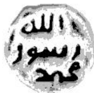
Pejgamberi i Allahut Mubammed

Pasuria, tokat, pronat e banimit dhe burimet e atij personi që përqafton Islamin dhe kryen namazin, do të mbesin në pronësinë e tij. Asgjë nuk do të merret prej sendeve në zotërim të tij. Allahu dhe Pejgamberi i Tij janë dëshmitarë të kësaj shkrese 107 .