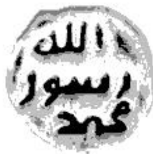
Pejgamberi i Allahut Muhammed

O ithtarë të Librit! Lini mënjanë të gjitha mosmarrëveshjet e polemikat dhe pajtohuni në një çështje, e cila është e njëjtë edhe për ne edhe për ju, dhe kjo është se nuk duhet të adhurojmë askënd tjetër përveç Allahut, se nuk duhet t'ia shoqërojmë askënd Atij dhe se nuk duhet të marrim ndokënd tjetër për Zot. Nëse ju e refuzoni këtë, duhet ta dini se ne, në çdo rrethanë, besojmë në Njëshmërinë e Allahut 35 .