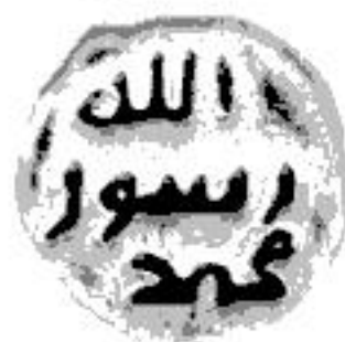
Pejgamberi i Allahut Muhammed

Uji i burimeve, ku po qëndrojnë këta njerëz, nuk duhet t'i mohohet ndokujt dhe ata nuk kanë të drejtë të bllokojnë ndonjë vend apo udhë detare 85 .