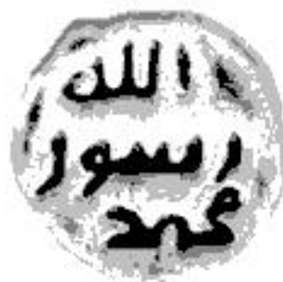
Pejgamberi i Allahut Muhammed

Cilido prej jush që përqafon Islamin, kryen namazin, paguan zekatin, qëndron i bindur ndaj Allahut dhe Pejgamberit të Tij (s.a.v.s.) e shokëve të tij, dëshmon hapur pranimin e Islamit dhe ndërpret lidhjet me pabesimtarët, është nën mbrojtjen e Allahut të Lartë e të Madhërishëm dhe të Pejgamberit të Tij (s.a.v.s.) 88 .