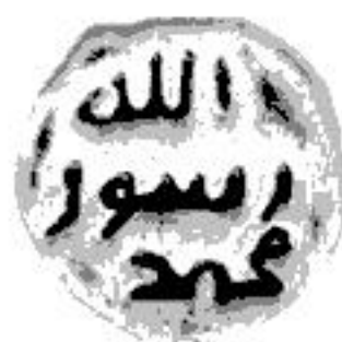
Pejgamberi i Allahut Mubammed

7. Allahu dhe Pejgamberi i tij dëshmojnë për këtë pakt 23 .