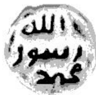
Pejgamberi i Allahut Muhammed

Pejgamberia ime është gati duke mbërritur në vendin tuaj. Nëse ju të dy pranoni Islamin, vendi juaj, si zakonisht, do të mbesë me ju. Por nëse ju refuzoni apo kundërshtoni, kjo është një çështje që zgjidhet shpejt 45 .