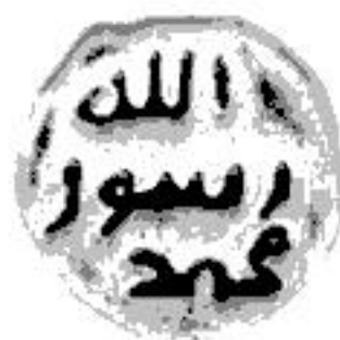
Pejgamberi i Allahut Muhammed