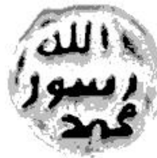
Pejgamberi i Allahut Mubammed