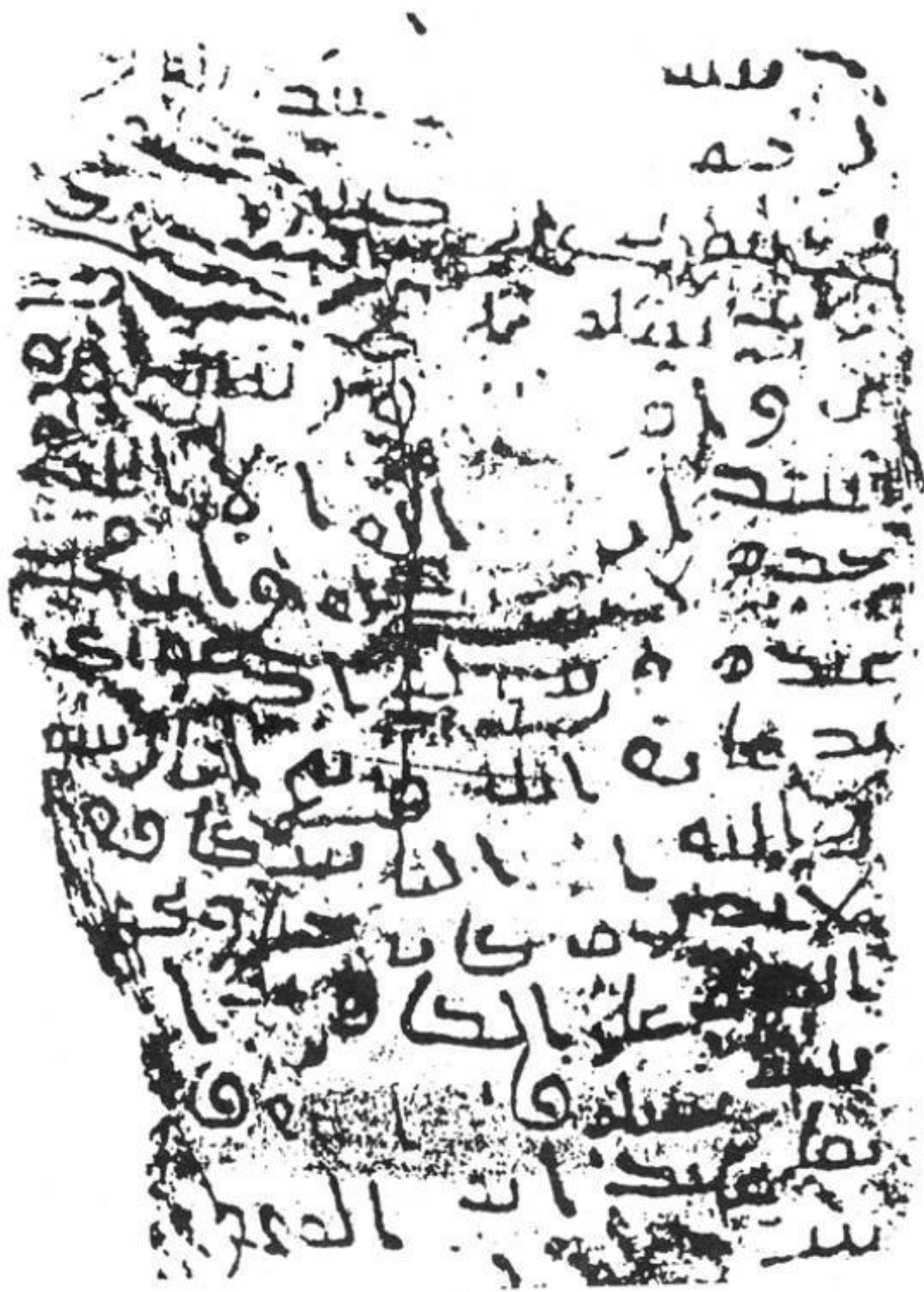
Letra e Pejgamberit, Muhammedit (s.a.v.s.), dërguar Husro Perwezit, Perandorit (Kisra) të Iranit