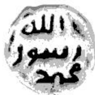
Pejgamberi i Allahut Muhammed

21. Vetëm personi që e ka blerë sendin ka të drejtën e shitjes së tij 19 .