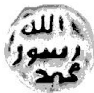
Pejgamberi i Allahut Muhammed

Shënim. Mu'adbi ishte një shok i respektuar i Pejgamberit (s.a.v.s.), i cili e përqafoi Islamin në moshë tepër të re, kur ishte 18 vjeç. Ai i përkiste Ensarëve. Pejgamberi (s.a.v.s.) e dërgoi atë për t'i mësuar muslimanët në Jemen, ndërkohë djali i tij vdiq. Me këtë rast Pejgamberi (s.a.v.s.) i shkroi atij letrën e mësipërme për ngushëllim, duke e këshilluar atë ta përballonte humbjen me durim.