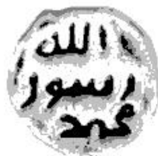
Pejgamberi i Allahut Mubammed

Cilido që do t'i përmbahet me vendosmëri këtij premtimi, do të jetë obligim i Pejgamberit (s.a.v.s.) ta ndihmojë atë. Dhe për cilindo që nuk do ta respektojë këtë premtim, kjo do të ishte në dëm të vetes së tij 102 .