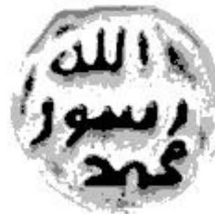
Pejgamberi i Allahut Muhammed