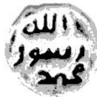
Pejgamberi i Allahut Muhammed