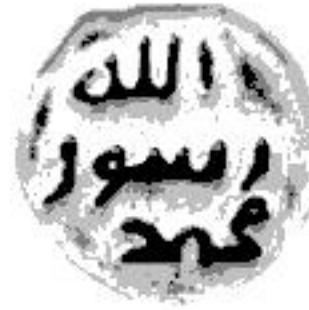
Pejgamberi i Allahut Mubammed