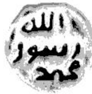
Pejgamberi i Allahut Muhammed

11. Për çdo gjë që është shkruar në këtë pakt, Allahu dhe Pejgamberi i Tij, Muhammedi (s.a.v.s.), janë garantues për to, derisa të ekzistojë urdhëri i Allahut në lidhje me këtë dhe për aq kohë sa populli i Nexhranit qëndron i devotshëm dhe u përmbahet me vendosmëri kushteve të cilat u janë vendosur atyre, me përjashtim të rastit kur dikush i detyron ata të veprojnë ndryshe 16 .