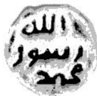
Pejgamberi i Allahut Muhammed

Përmbushja e të gjitha atyre që u shkruan në këtë letër garantohet me besnikëri prej anës sonë, të cilën e dëshmojnë Allahu dhe të gjithë muslimanët e pranishëm 54 .