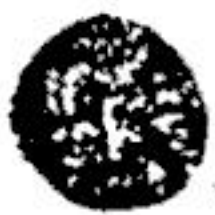
Letra e Pejgamberit Muhammed (s.a.v.s.), dërguar Mukaukisit, mëkëmbësit të Egjiptit

سَمِ اللَّهِ الرَّحْمَنِ الرَّحِيمِ مِنَ مُحَمَّدٍ عَبْدِ اللَّهِ وَرَسُولِهِ سَوَّلَ إِلَى الْمُتَّقِينَ تَطْمِينًا لِقُلُوبِهِمْ وَأَمْرًا غَلِيظًا مِنْ أَنْ يَشْبَعَ الْعَرَبُ مِنْ دِيَارِهَا بِعَثْرِ فَنِي إِذْ عَوَّزْتُ بِعَسَائِيهِ الْإِسْلَامَ اسْتَلِمَ نَبِيَّكُمْ يَوْمَ الْكَلْبِ إِنَّهُ جَرَدٌ مَرْتِينٌ فَإِنْ تَوَلَّيْتُمْ فَلْيَكِلْتُمْ أَشْرَافَ الْقَبِيْلِطِ يَا حَسْرَةَ الْكِلْبِ تَبِعْتُمُ الْوَالِيَّ كَلْبَ تَبِعْتُمْ سَوَاءٌ بَيْنَنَا وَسَيِّئِكُمْ أَنْ لَا نَعْتَبَهُ إِلَّا أَنَّهُ وَلَا تَشْرِكْ بِرَبِّ شَيْئًا وَلَا تَتَّخِذْ مِنْ بَعْضِنَا بَعْضًا أَرْبَابًا مِنْ دُونِ اللَّهِ إِنَّكَ تَفْتَنُونَ تَوَلَّوْا فَرَقْتُمْ لَوْلَا إِشْرَاقُهَا بِأَبْرَارِهَا آمَنُونَ