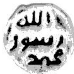
Pejgamberi i Allahut Muhammed