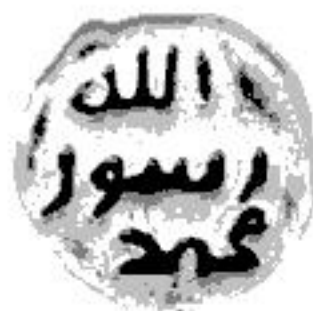
Pejgamberi i Allahut Muhammed