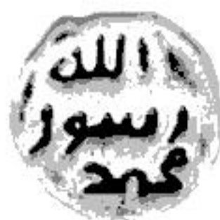
Pejgamberi i Allahut Muhammed

Askush nuk do t'i këpusë frutat e prodhuara prej banorëve të fisit Barik, përveçse me lejen e tyre. Nuk do të lejohet kullotja e kafshëve në livadhet e tyre në ndonjë prej stinëve të dimrit dhe të verës. Sidoqoftë, nëse ndonjë musliman, duke mos pasur livadh, kalon nëpërmjet tokës së tyre me kafshë për t'i kullotur ato, do të jetë në përgjegjësinë e banorëve të fisit Barik ta mirëpresin atë, e shumta për tri ditë. Kur frutat në kopshtet e tyre të piqen, udhëtari gëzon të drejtën të mbledhë dhe të hajë prej frutave të rëna aq sa të plotësojë dëshirën e tij, por ai nuk gëzon të drejtën të bartë fruta me vete 91 .