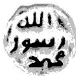
Pejgamberi i Allahut Mubammed