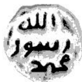
Pejgamberi i Allahut Muhammed

Paqja, mirësitë dhe bekimet e Allahut qofshin mbi ju!