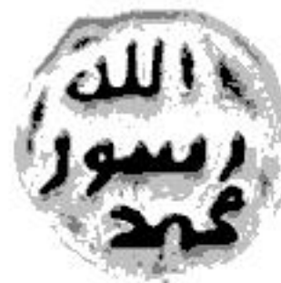
Pejgamberi i Allahut Muhammed

Kushdo që do të mundohet t'i privojë ata nga kjo pronësia, mallkimi i Allahut dhe engjëjve të Tij do të bie mbi të 86 .