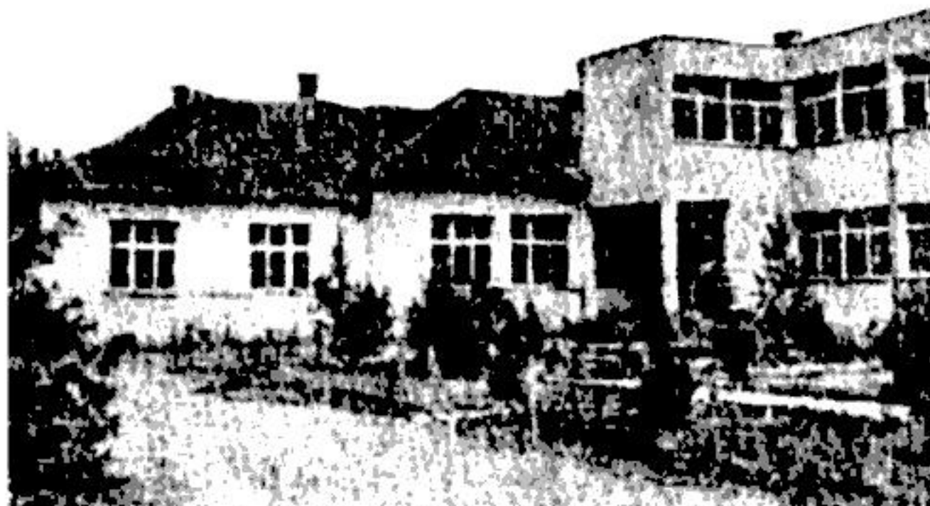
Foto 2 - Shkolla moderne

Fondi republikan për shkollim, në periudhën 1961-1963 më shumë angazhohej për atë që të ndërtohen shkolla qendrore tetëvjeçare, sidomos në ato vende ku si shkolla ende shfrytëzoheshin shtëpitë private ose medresetë e xhamive. Tërmeti katastrofal i Shkupit (1963) dhe i Dibrës (1967) e penguan planifikimin e ndërtimit të shkollave, ngase të gjitha mjetet iu dërguan Shkupit dhe Dibrës për ndërtimin dhe adaptimin e shkollave të rrënuara. Në disa komuna nga vetëkontributi i qytetarëve ndërtohen shkolla të reja.