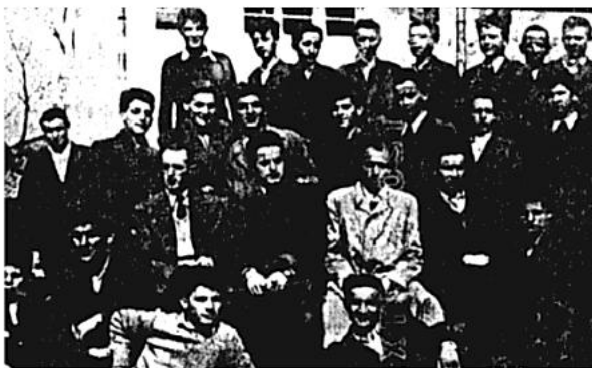
Foto 3 - Gjenerata e parë e mësuesve

Në vitin shkollor 1947/48, pranë Shkollës Normale maqedonase “Nikolla Karev” në Shkup, u formua paralelja e parë e kësaj shkolle me mësim në gjuhën shqipe, dhe kjo më vonë shërbeu si nukleus për hapjen e shkollave të para normale në gjuhën shqipe.